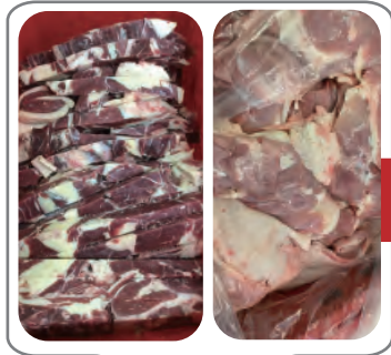
Preparación y marinado de carne Ternera, pollo, cordero, pavo, etc.