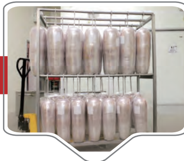
Almacenar y mantener congelado