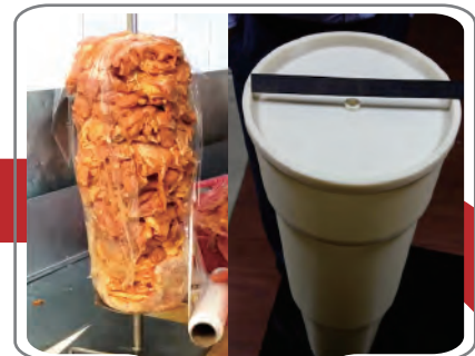
Apilamiento manual / Conformación o embutido en molde