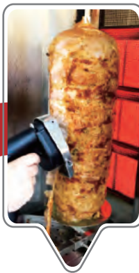
Hasta su calentamiento