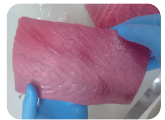
Resultado: Filete reestructurado entero de excelente calidad en corte