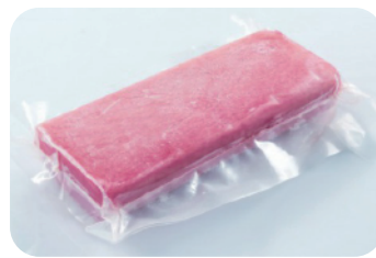
Dejar reposar mínimo 8 horas al vacío en temperatura de refrigeración