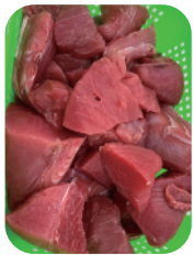
Recortes de Atún