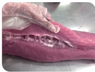
Esparza en polvo o en solución el Prolink FB-FC