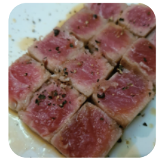
Platillo cocinado, estable al tratamiento térmico