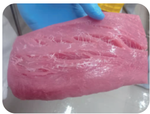
Filete de Atun Inicial